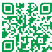
Podlaska Biblioteka Cyfrowa

Biblioteka Uniwersytecka udostępnia również inne kolekcje cyfrowe poświęcone regionowi. Są to Podlaskie Czasopisma Regionalne oraz Kolekcje cyfrowe Biblioteki Uniwersyteckiej . Są one stale rozwijane i uzupełniane o nowe obiekty oraz publikacje.