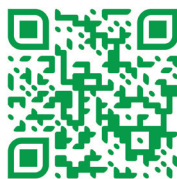
Kolekcje cyfrowe Biblioteki Uniwersyteckiej